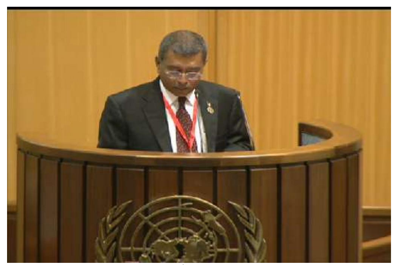
י אים בית השל הב לבין שימים בלאמת של הב. בשקרבת פני בל המים בין בל המים בין ביני בל המים בין בל המים בין בל המי