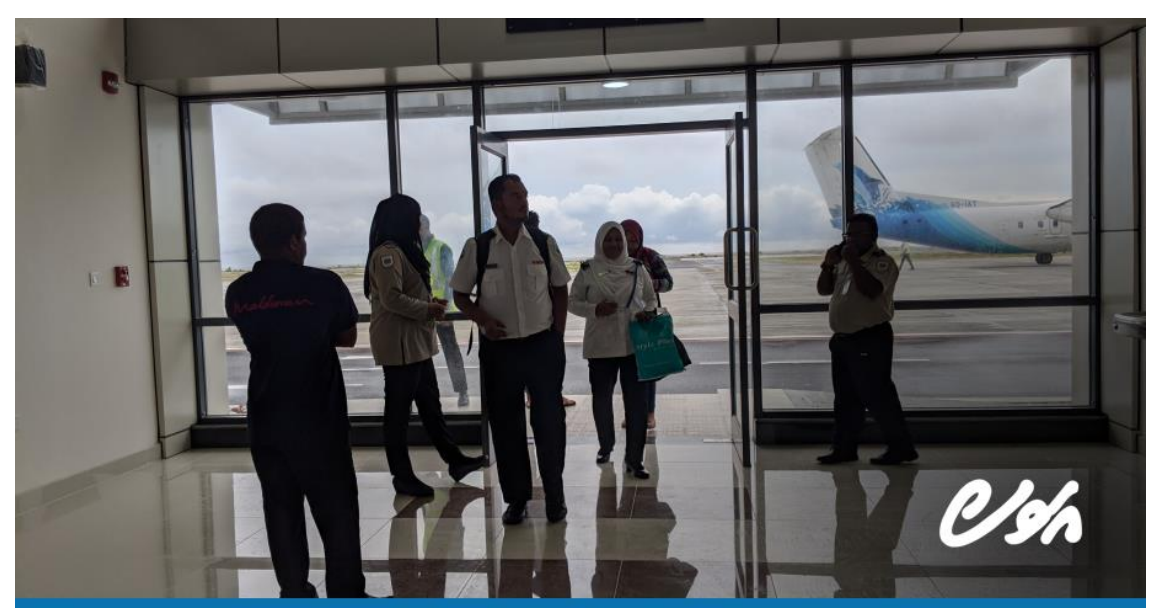
REPORT: VIA nuhulhuva tourism feshidaane tha?