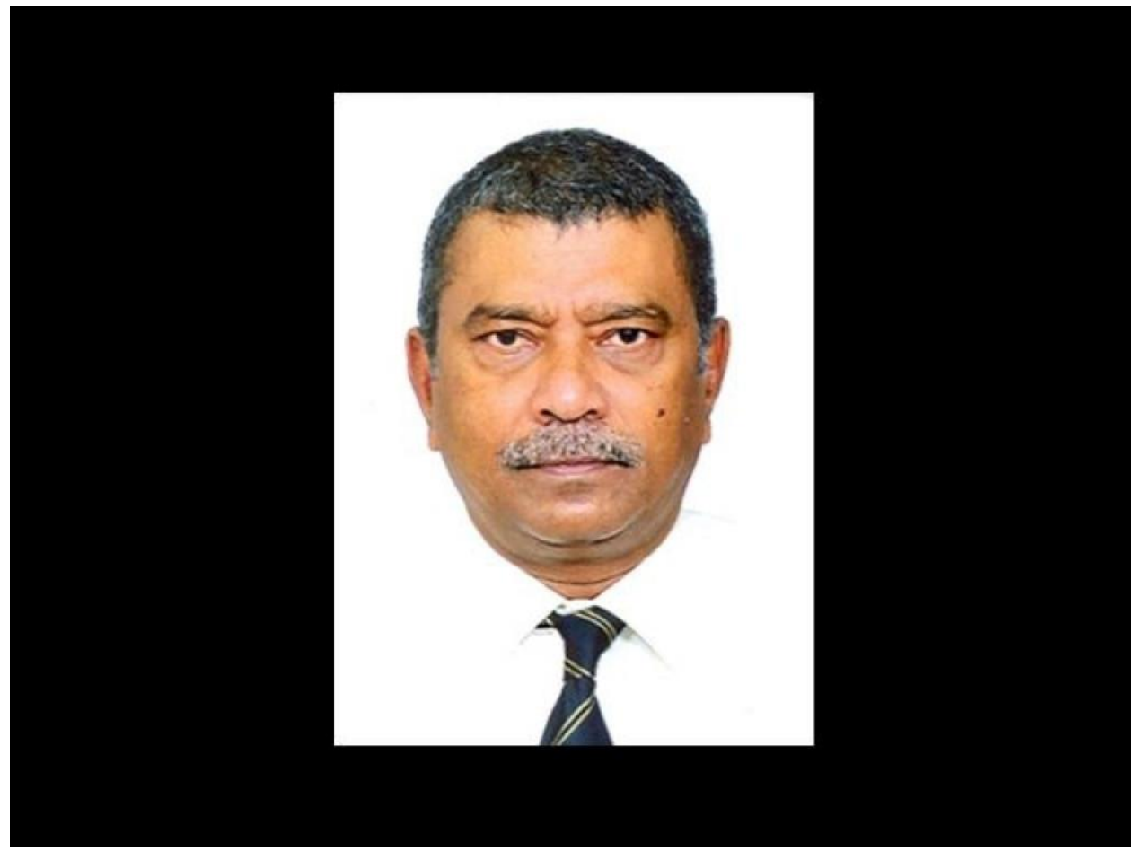
مری کوکرسیم کر وسرس وسرسی کر درکرو نے ور