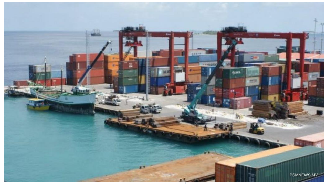
हैं दूर्त हैं र वेस दे रहे है र पेर वे दूर्य के हैं र वेस दे र वे हैं से हैं स

https://psmnews.mv/70548 - ﴿ رَبِّ مُصَّارُهُمُ مُ