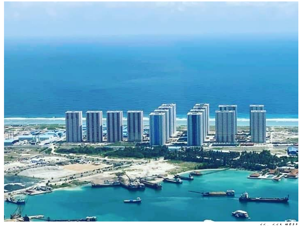
רצבו בקפות בחפר

https://vaguthu.mv/viyafaari/378064 - ارَّرُوْ مَرُوَّعُ