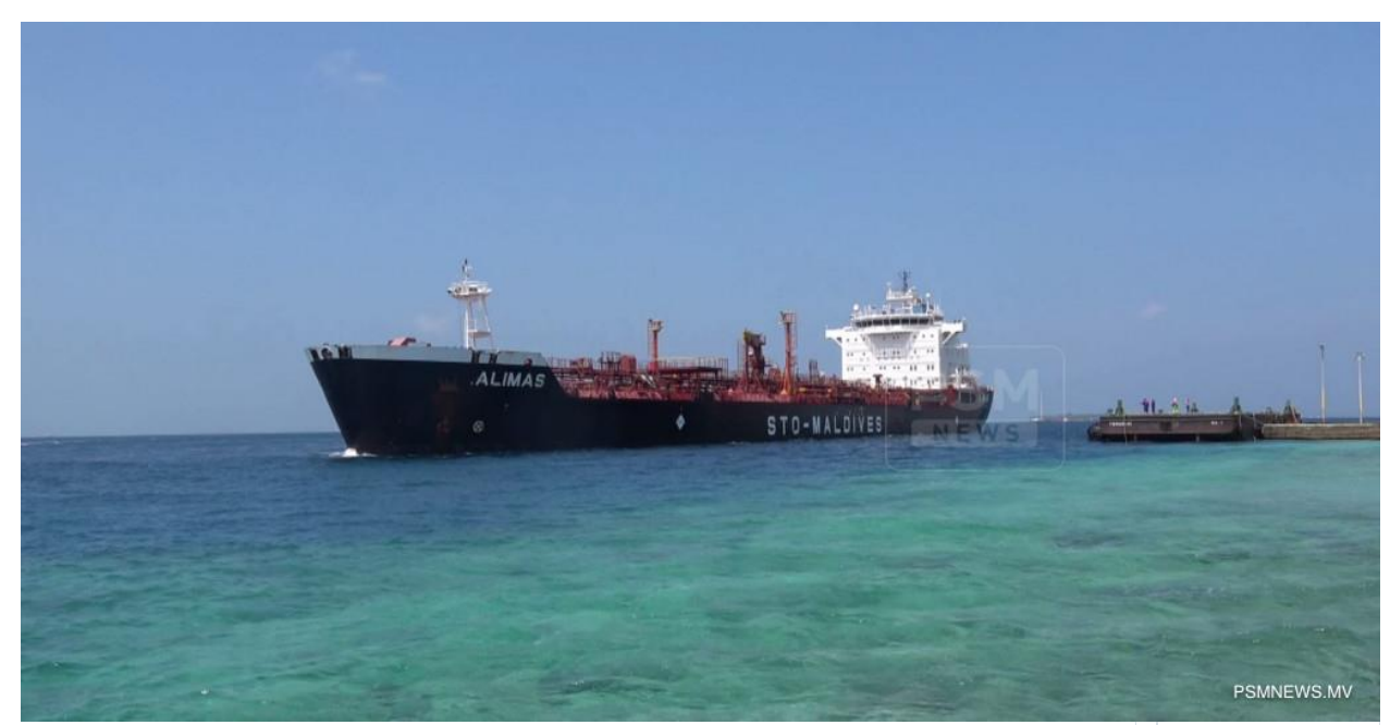
مُرَّدُجُ يُ سُورِرُمُ وَرِيرُم

https://psmnews.mv/71181 - گُرِمِوَ ثُمُ سُّعُمَّرُ